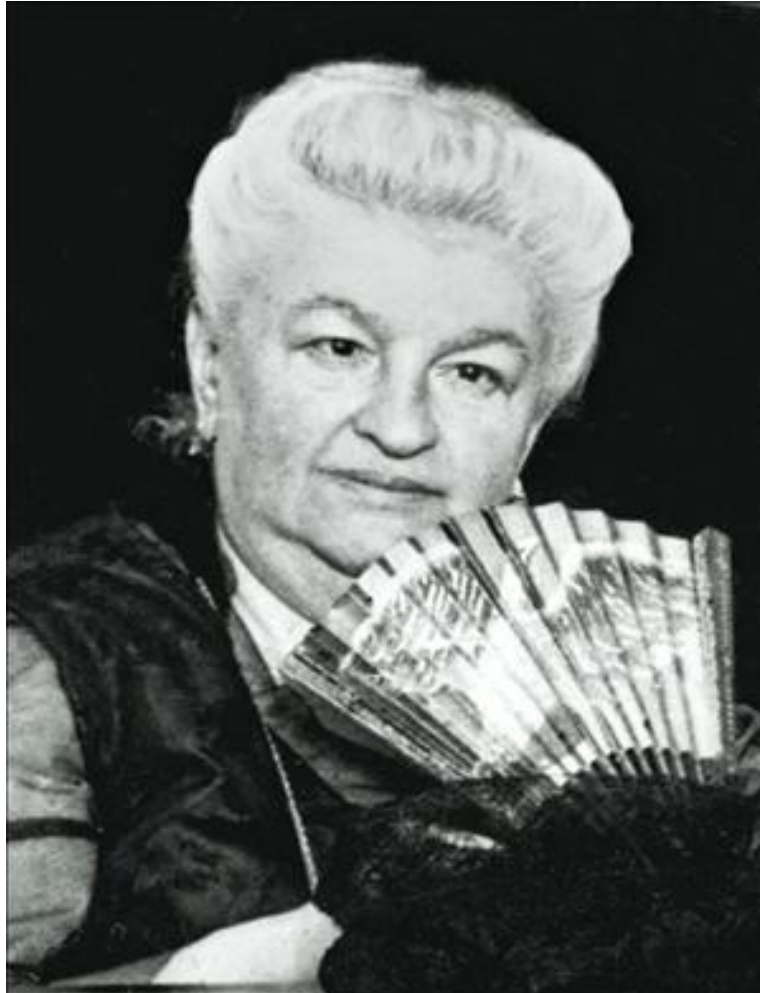
Emilia Pardo Bazán