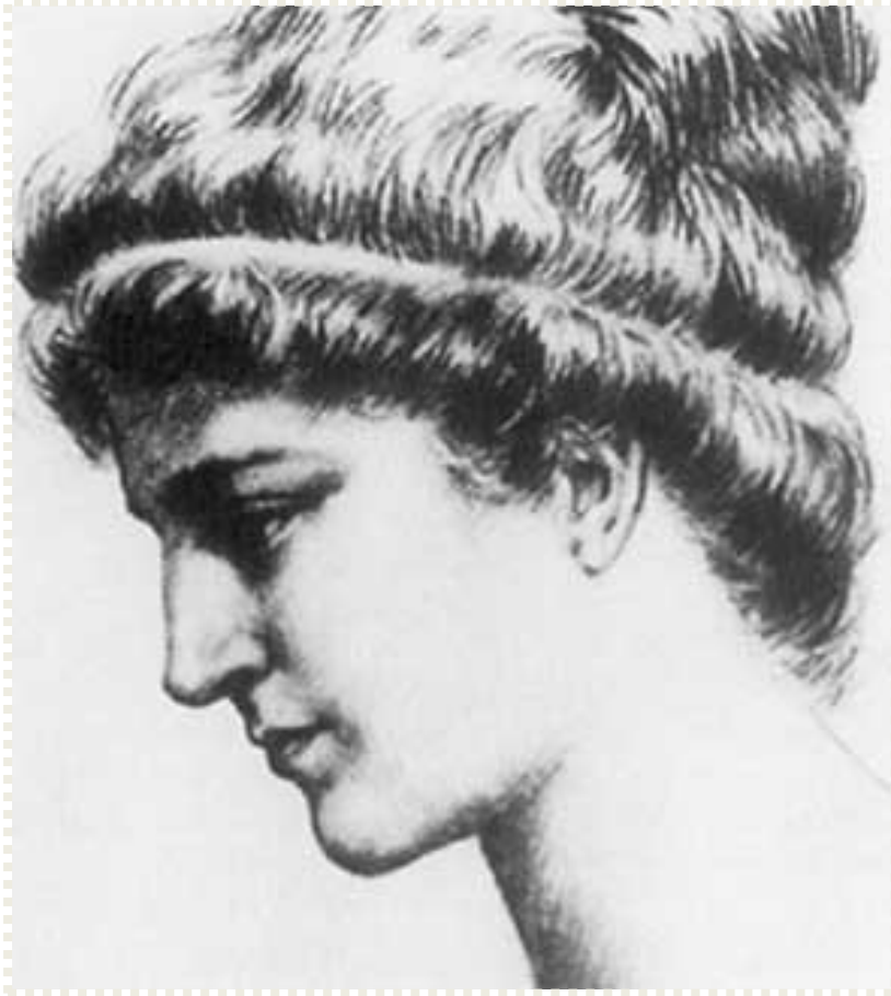
Hypatia de Alejandría