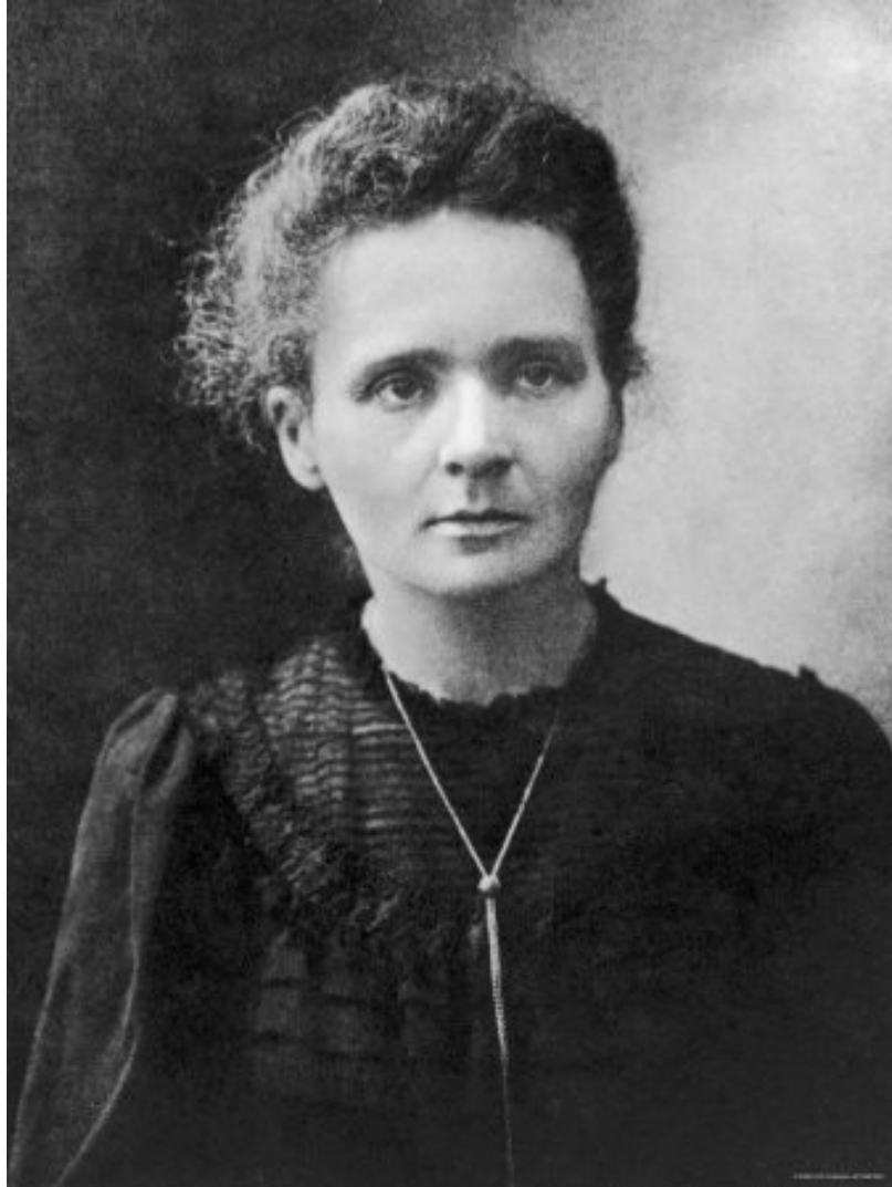
Marie Curie (1867-1934)