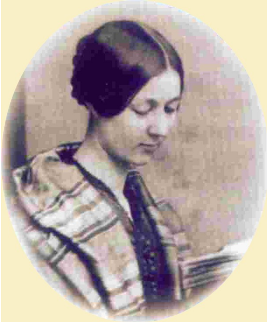
Florence Nightingale (1820-1910)