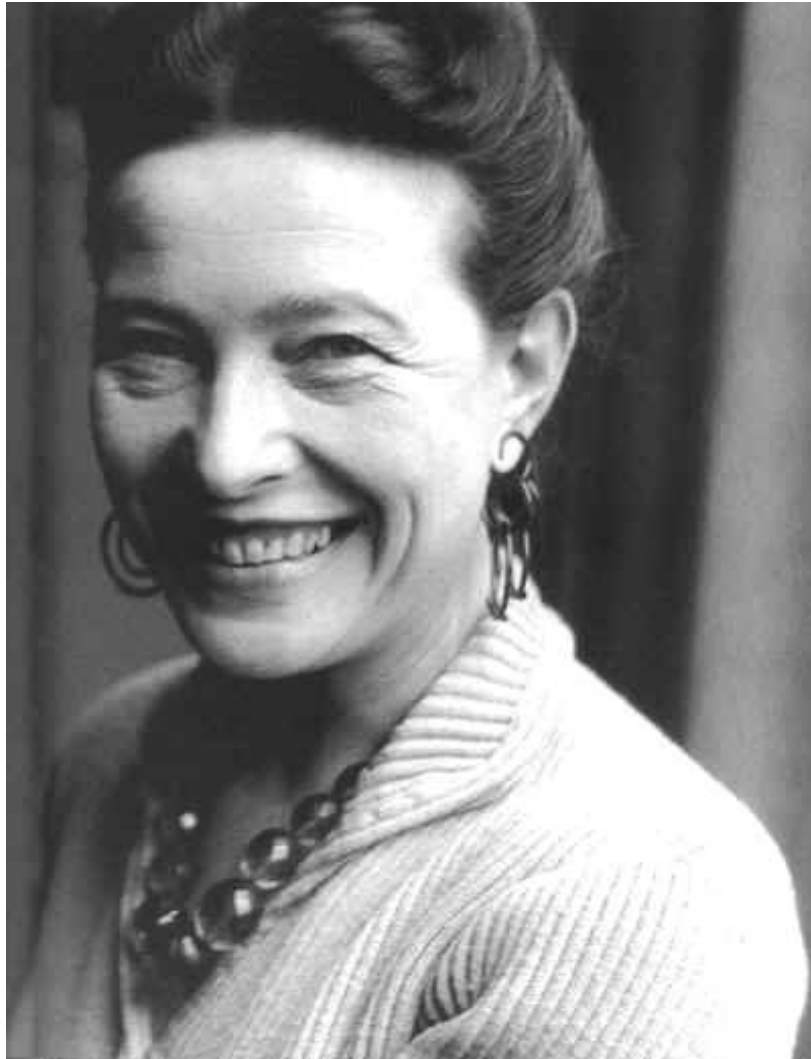
Simone de Beauvoir