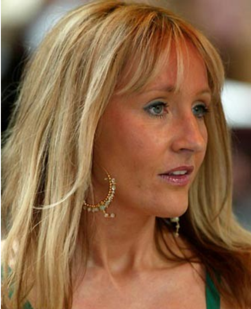
Joanne K. Rowling