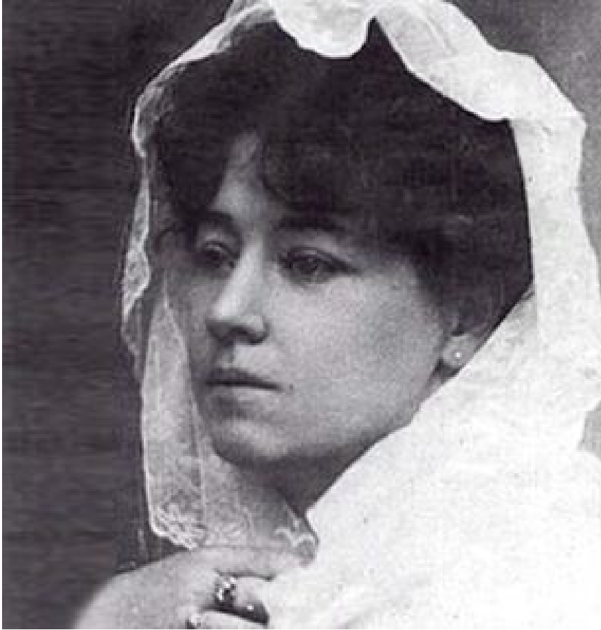
Alice Guy Blaché