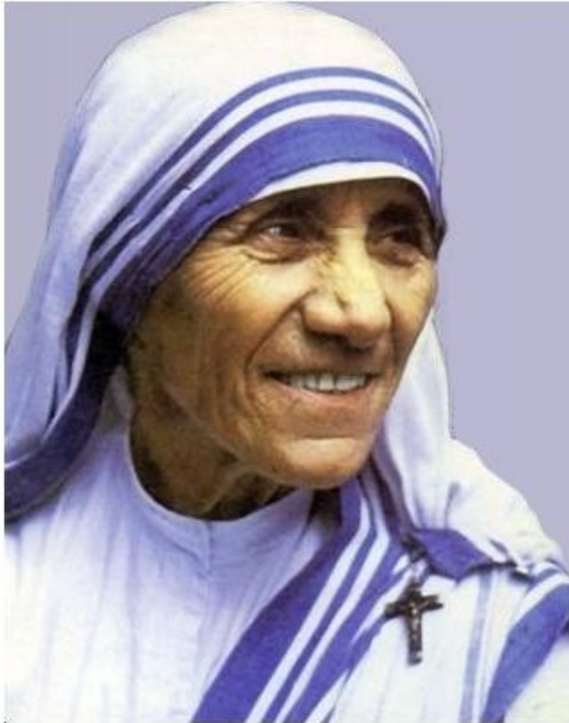
Teresa de Calcuta