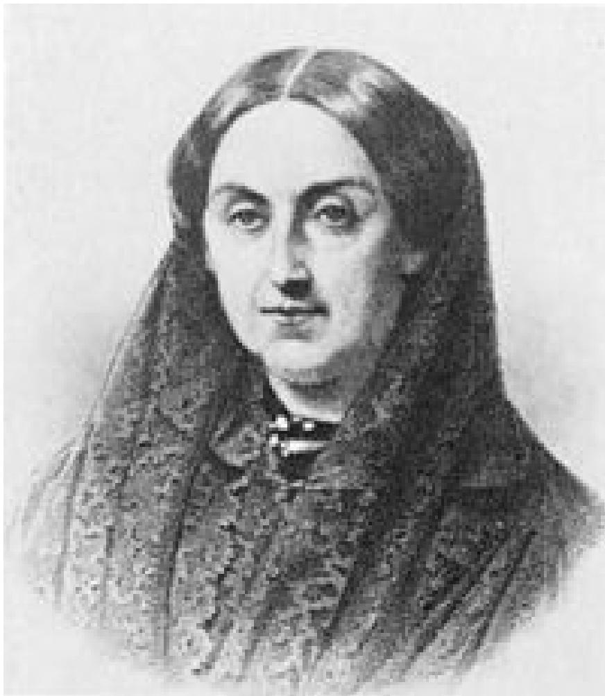
Fernán Caballero (pseudónimo) de Cecilia Böhl de Faber y Larrea