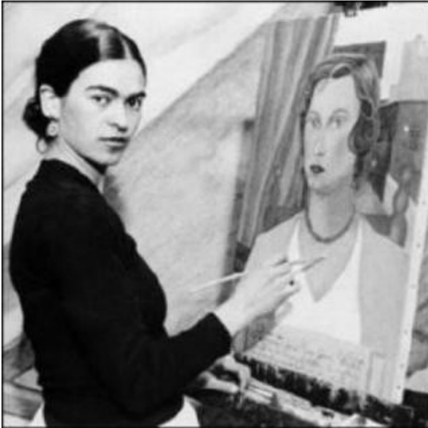
Frida Kahlo (1907-1954)