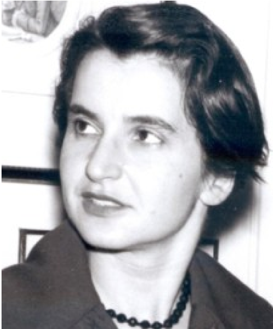
Rosalind Elsie Franklin